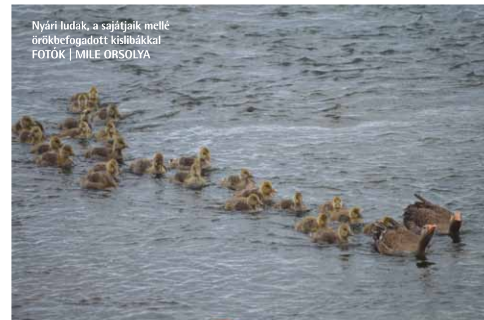
Nyári ludak, a sajátjaik mellé örökbefogadott kislibákkal