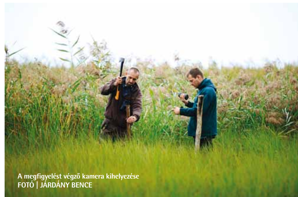
A megfigyelést végző kamera kihelyezése

A Kelemen-szék és Miklapusztá közé ékelődött Böddi-székre az idén is bármikor érdemes ellátogatni. A körülbelül ezerhektáros, szikes tavon és szikes pusztán nincsenek beláthatatlan távolságok. Kis túzással szinte minden