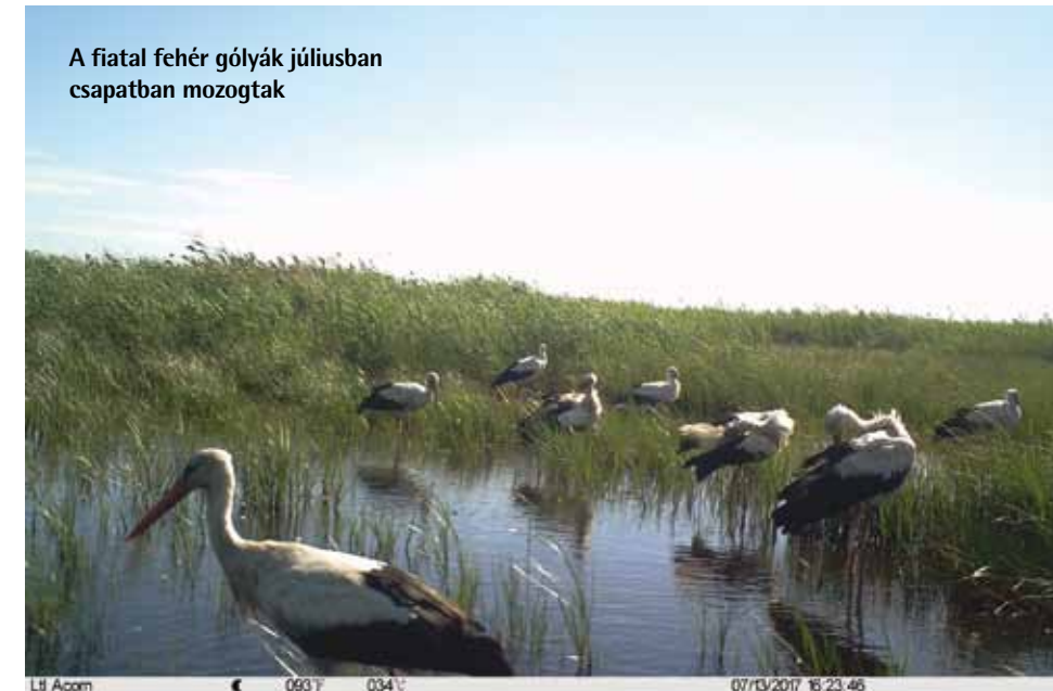
A fiatal fehér gólyák júliusban csapatban mozogtak

karnyújtásnyira van, így hosszú túrák nélkül is rengeteg madárfaj kényelmesen megfigyelhető.